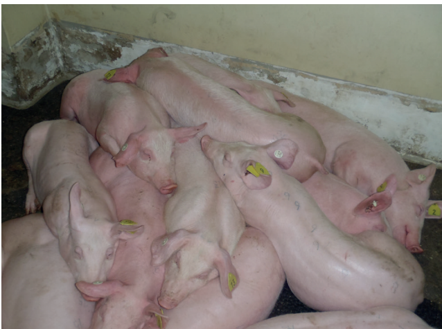
Abb. 3: Hausschweine mit hohem Fieber

Die Erkrankung ist auf der Basis klinischer Symptome nicht von der klassischen Schweinepest (KSP) und anderen schweren Krankheitsverläufen zu unterscheiden!