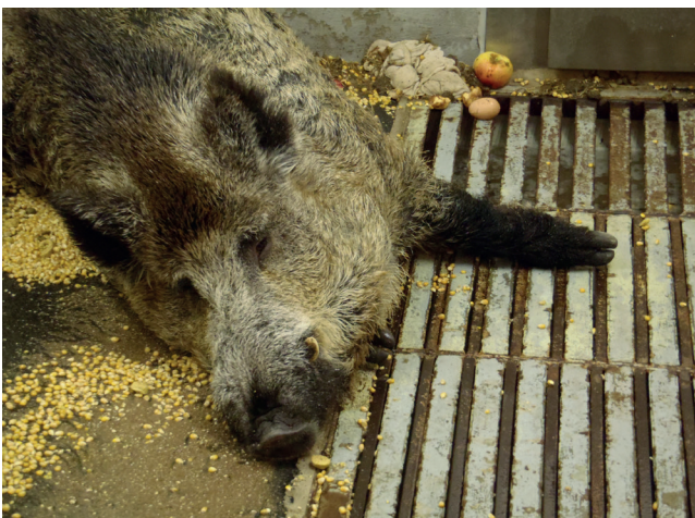
Abb. 4: Keiler mit unspezifischen Symptomen