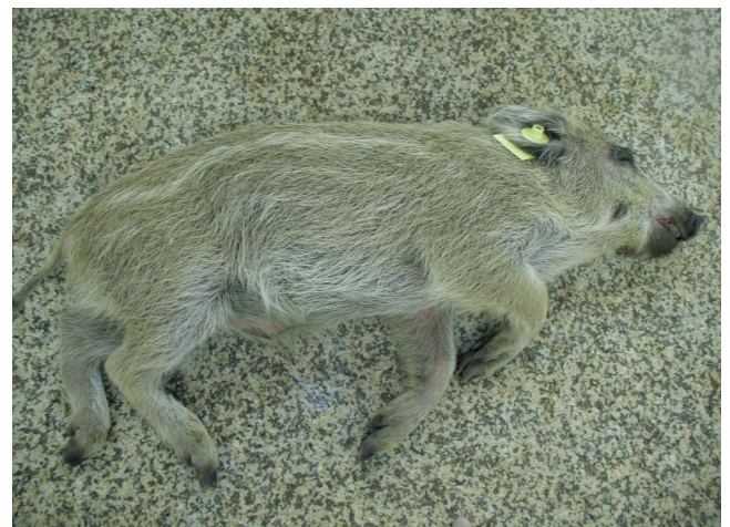
Abb. 5: Perakut verstorbener Frischling

Für den Antikörpernachweis in Serum und Plasma stehen mehrere, bisher in Deutschland nicht zugelassene ELISA-Kits zur Verfügung. Darüber hinaus können Antikörper mittels indirekter Immunfluoreszenz- oder Immunperoxidasetests nachgewiesen werden. Immunoblots werden ebenfalls eingesetzt. Probenmaterial der Wahl ist Serum.